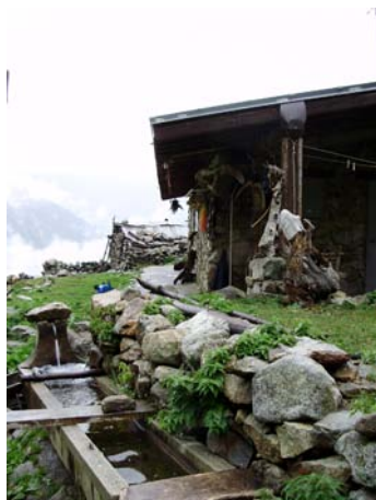
▲ Alpe Vagliotta