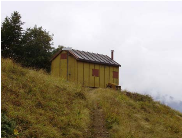
▲ Capanna Barbero