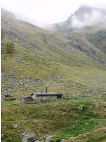
▲ Alpe Vagliotta e Passo Barra Vagliotta

Eventi: a Valdieri la terza domenica d'agosto: Festa della segale con corteo storico, concerto occitano, mercatino enogastronomico.